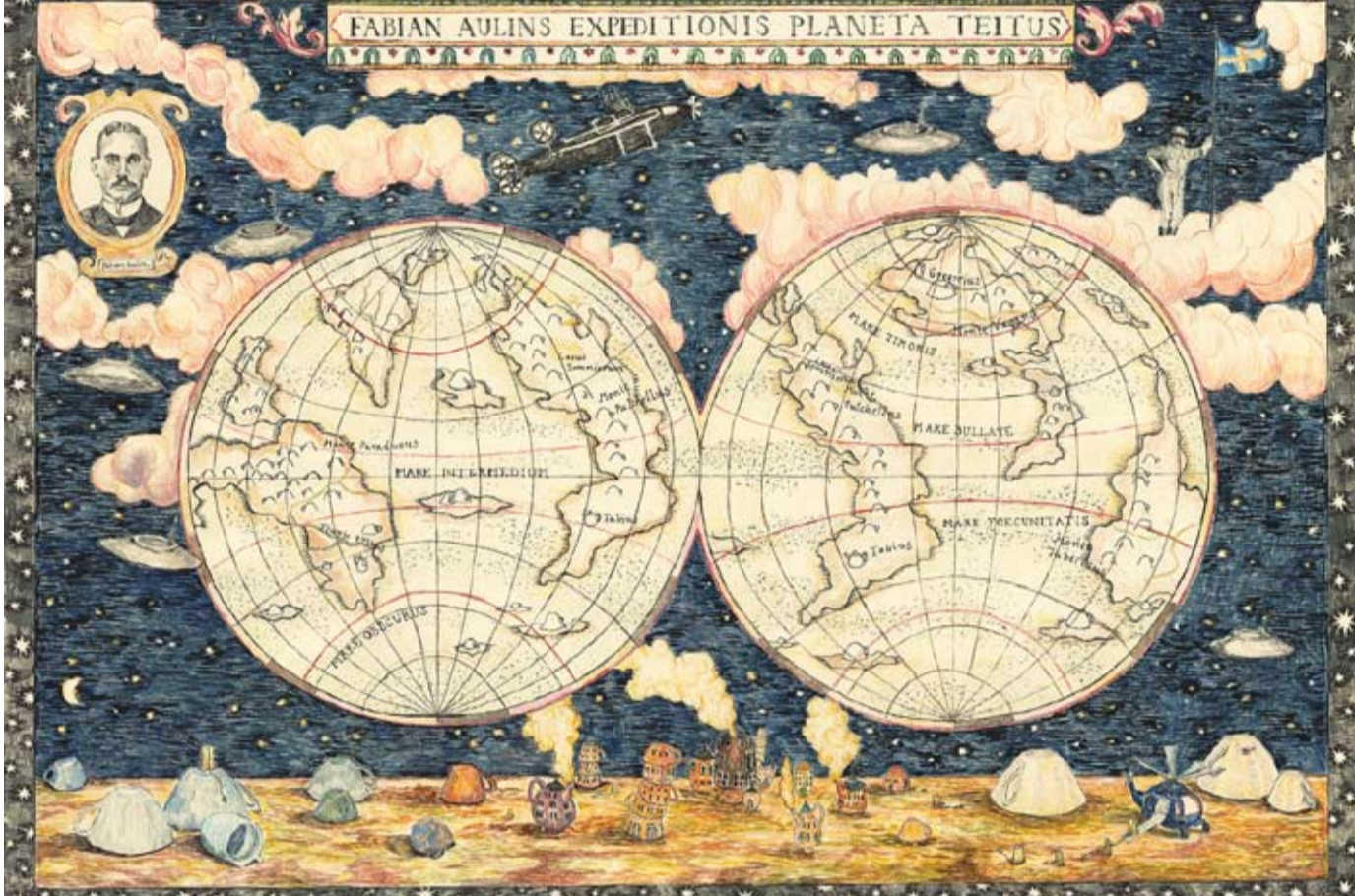
Karta över planeten Teitus af Greger Fogelström 1906.