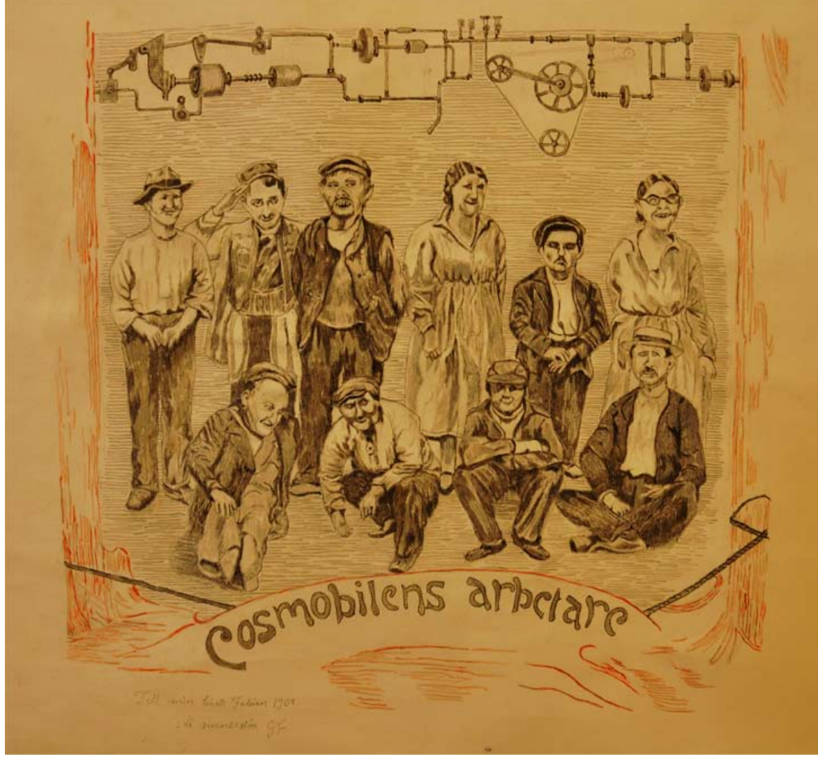
Cosmobilens arbetare illustrerad av Greger Fogelström som en gåva till Fabian Aulin 1905