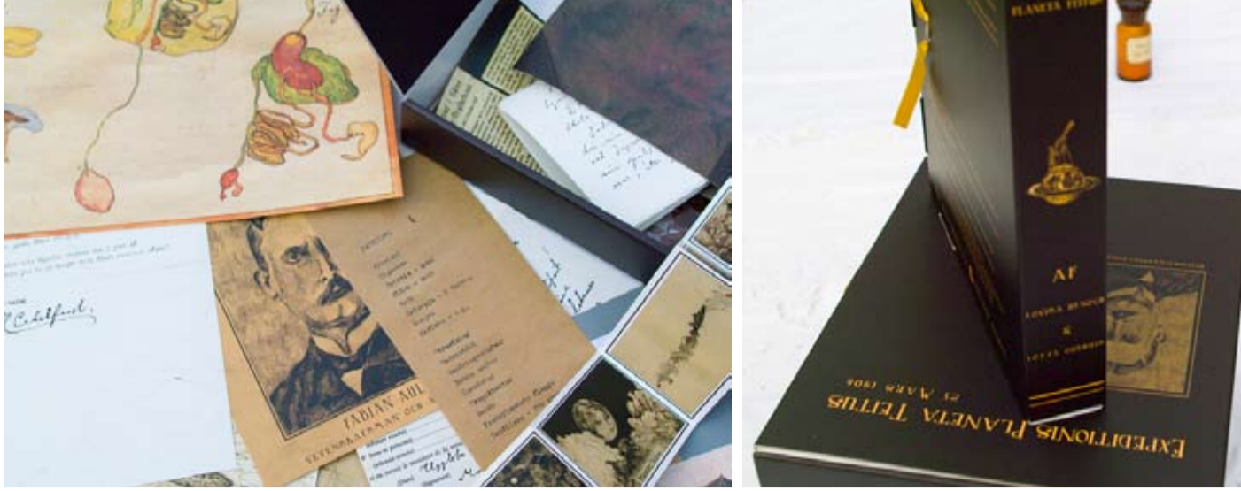
Kompilationsromanen Expeditionis Planeta Teitus. Mer bildmaterial följer nedan.